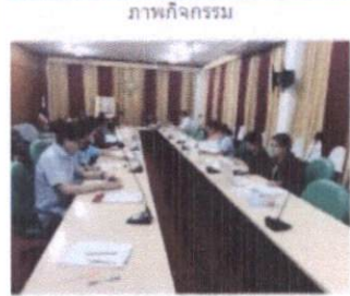
เชื่อมโยง กระทรวงสาธารณสุข